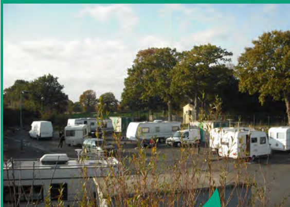
L'aire d'accueil des gens du voyage comporte 8 emplacements pour 16 caravanes