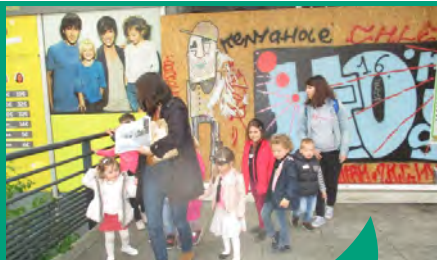
L'ALSH accueille les enfants de 3 à 12 ans le mercredi et pendant les vacances scolaires.