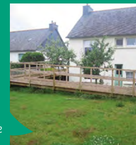
Aménagement pour favoriser l'autonomie