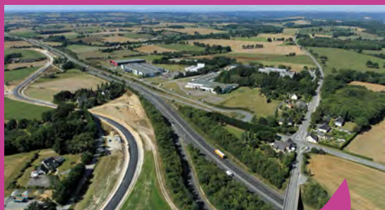
Le parc d'activités Le Mafay est attractif avec un accès direct à l'échangeur de l'axe Nantes-Rennes. Son extension est à l'étude.