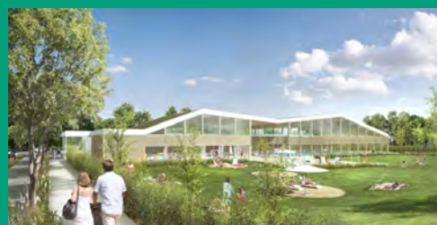
Esquisse de la vue extérieure de la future piscine intercommunale (BVL architecture).

Les études d'avant-projet se poursuivent avec l'équipe de maîtrise d'œuvre retenue en 2019. Des études géotechniques et hydrologiques ont notamment été complétées afin de pouvoir répondre à des contraintes de sol.