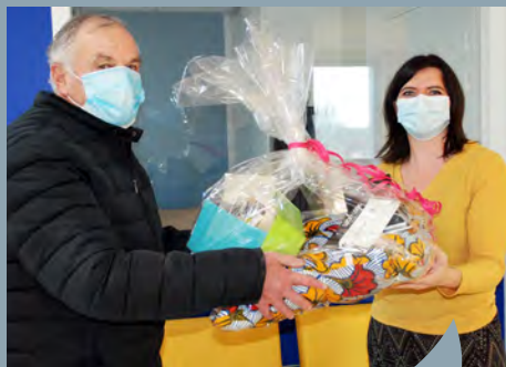
Lancée pendant les fêtes de fin d'année, l'opération commerciale C'KDO a mobilisé 10 000 € en faveur des commerçants du territoire.

Sous sa marque touristique « Vallons en Bretagne », VHBC valorise et fait la promotion de ses atouts touristiques via sa documentation de communication :