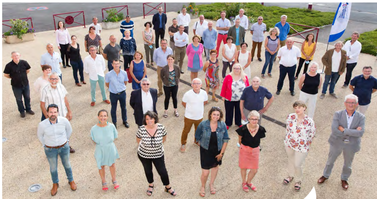
Les élus communautaires sur le parvis de l'Espace culturel du Rotz (Val d'Anast), le 9 juillet 2020.