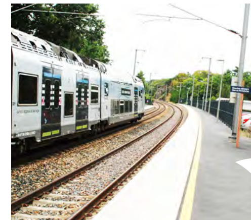
Chaque jour, le train reliant les villes de Rennes et Redon dessert la gare et les haltes ferroviaires du territoire.

Vallons de Haute Bretagne Communauté exerce ses compétences afin de répondre aux besoins des habitants et des entreprises installés sur son territoire. Aux compétences obligatoires s'ajoutent les compétences optionnelles et facultatives déléguées par les communes membres.