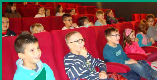
Ouvrir les enfants à la culture ...

... et à de nouvelles pratiques de sports et de loisirs font partie des missions de l'ALSH (ici au jardin de Brocéliande).