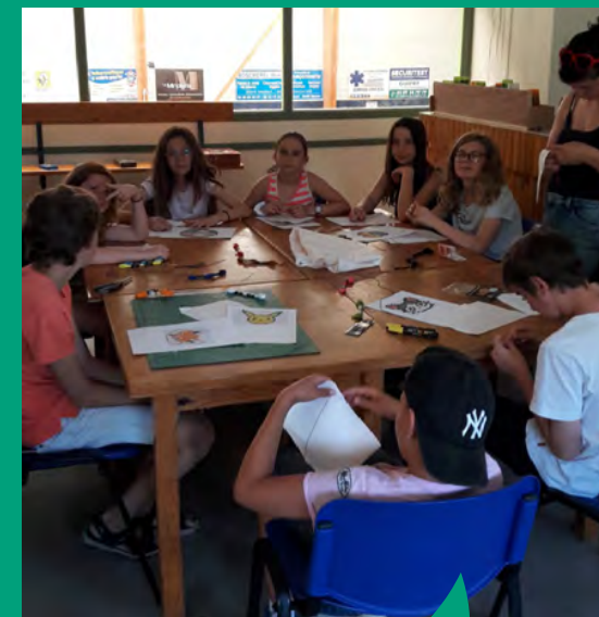
Activité de l'animation jeunesse communautaire à Guipry-Messac

L'animation jeunesse communautaire est une offre de loisirs organisée, chaque année, au mois de juillet. Elle s'adresse à tous les jeunes du territoire âgés de 11 à 17 ans. Elle est gérée par le Clad-UFCV pour le secteur de Guichen et par Léo Lagrange Ouest pour le secteur de Val d'Anast et Guipry-Messac.