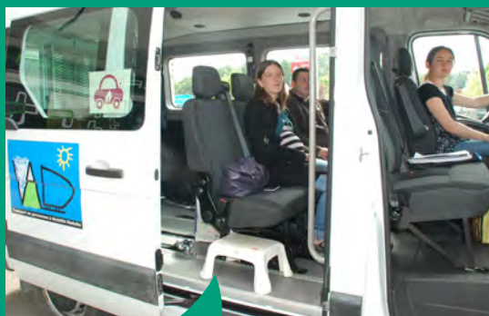
Le transport à la demande Naveteo Car propose un rabattement vers les lignes du réseau régional BreizhGo.