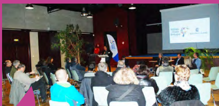
Rencontre économique à Guignen