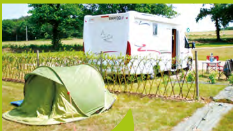
L'éco-camping des Buis à Les Brulais