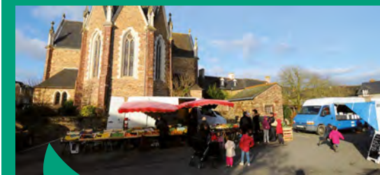
Dynamisme des centre-bourgs