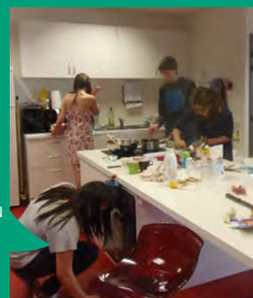
Espace jeunes à Val d'Anast