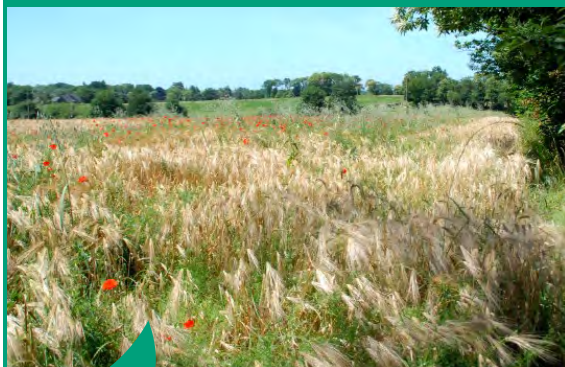
Grâce au programme Breizh bocage, la Communauté de communes participe à la reconstitution du maillage bocager