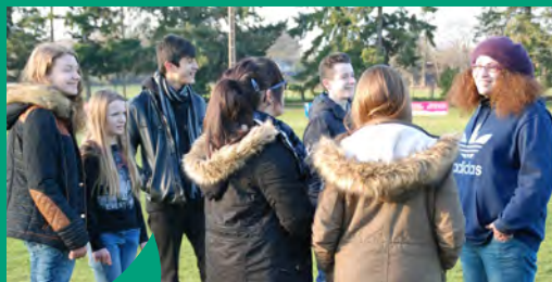
Espace jeunes en itinérance