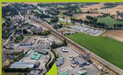
Zone d'activités Bonabry, Guipry-Messac