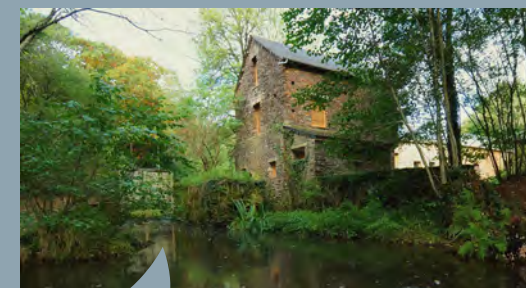
Le Moulin du Ritoir a accueilli près de 400 visiteurs au cours de l'été 2020.