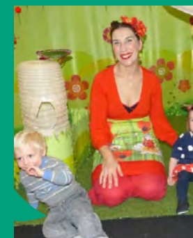
Spectacle au RIPAME