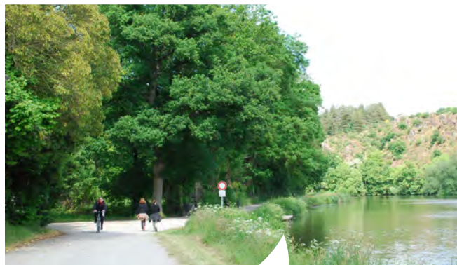
Chemin de halage Le Boël, Pont-Réan

Le conseil communautaire est l'organe délibérant qui se réunit pour débattre et gérer les affaires de l'intercommunalité par délibérations, selon un ordre du jour. Il est également chargé d'examiner et de voter le budget communautaire