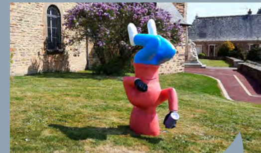
Le projet mené sur le site de la Vigne à La Chapelle-Bouëxic correspond parfaitement à l'un des axes de développement de la Destination Rennes et les Portes de Bretagne.