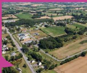
Parc d'activités Le Clos de la Barre, Guipry-Messac