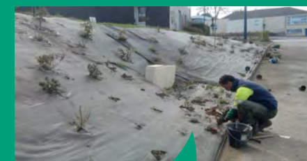
Entretien des espaces verts