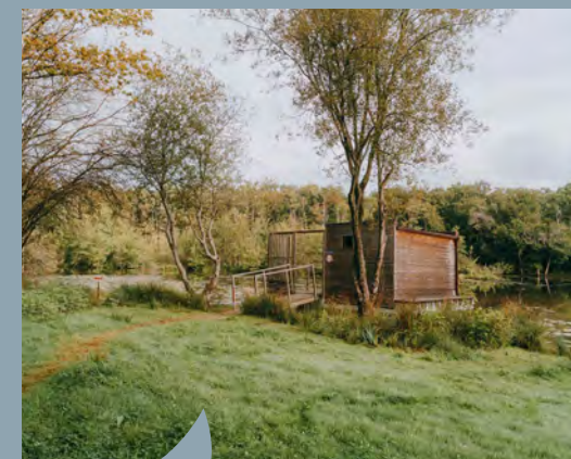
Situé à proximité de la voie verte Messac-Guer, l'éco-camping accueille de nombreux cyclotouristes

Deux personnes ont été recrutées pour assurer des permanences lors de dix dimanches estivaux. Au total, plus de 400 visiteurs y ont été accueillis.