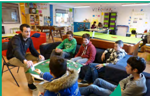
Espace jeunes à Guipry-Messac