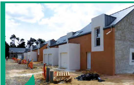
Construction de logements neufs