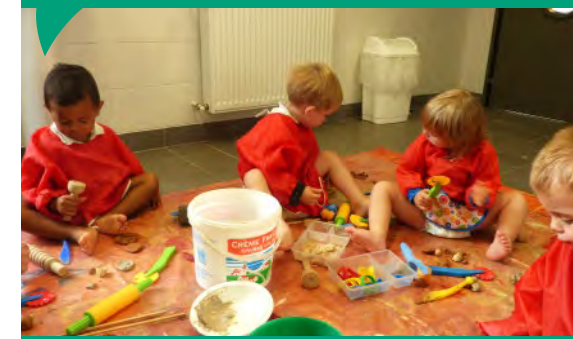
Atelier argile et barbotine au multi-accueil.