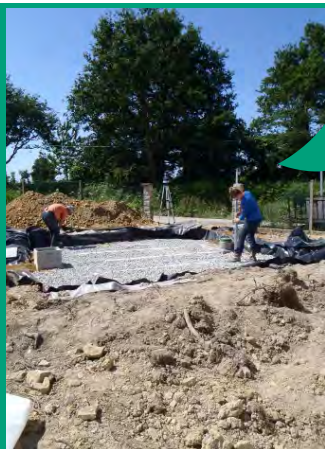
Contrôle du SPANC