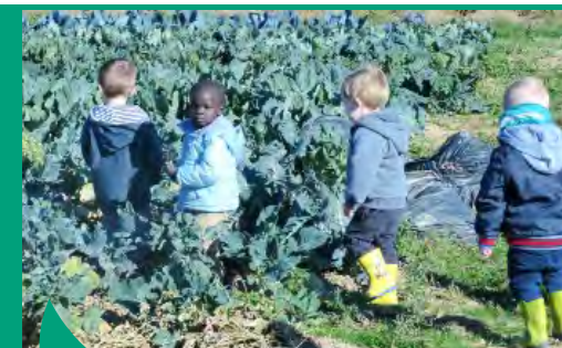
Cueillette à la ferme