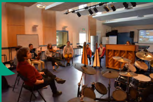
Stage ciné concert création musique Février 2020