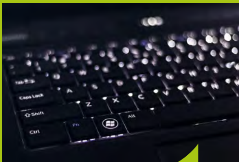
Un service mutualisé d'administration des systèmes d'information a vu le jour entre la Communauté de commune et les communes de Guichen et de Guipry-Messac.