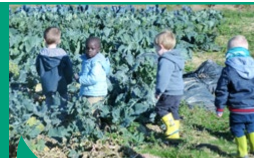
Cueillette à la ferme