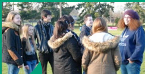
Espace jeunes en itinérance