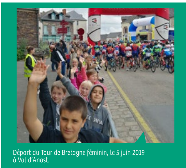
Départ du Tour de Bretagne féminin, le 5 juin 2019 à Val d'Anast.