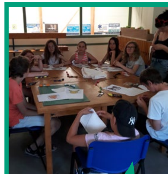
Activité de l'animation jeunesse communautaire à Guipry-Messac