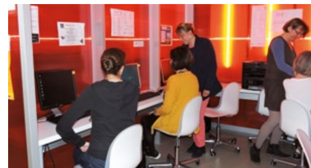
Des ateliers informatiques pour les grands débutants sont organisés par le PAE.