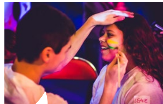
Les Nocturnes font partie des événements phares organisés par les PIJ.

Les PIJ ont pour but d'offrir un égal accès à l'information pour tous les jeunes du territoire, quelle que soit leur commune de résidence. Par ailleurs les animateurs des Points information jeunesse proposent d'accompagner les jeunes dans leurs projets individuels et collectifs, qu'il s'agisse de voyage, de formation... Des dispositifs de financement peuvent d'ailleurs être mis en place pour mener à bien ces projets.