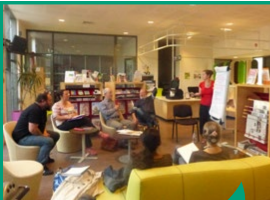
Au Chorus, un Conseil des habitants participe à l'animation du Centre social.