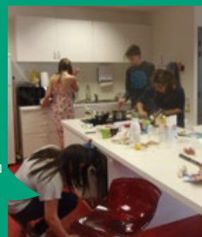
Espace jeunes à Val d'Anast