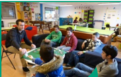
Espace jeunes à Guipry-Messac