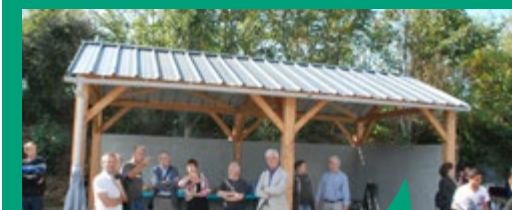
Inauguration du préau construit par le chantier d'insertion au sein de l'aire d'accueil des gens du voyage à Guichen