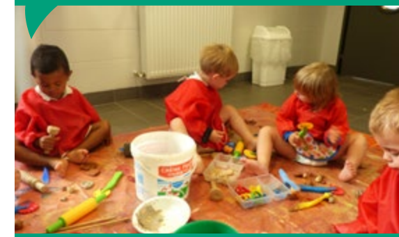
Atelier argile et barbotine au multi-accueil.