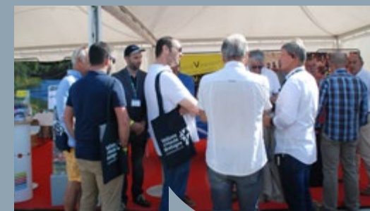
Le stand Vallons en Bretagne était installé au cœur de la fan zone du Rallycross de Lohéac. 600 personnes ont participé au jeu-concours, une séance de dédicaces des pilotes français y a été organisée et les acteurs économiques du territoire ont été conviés dans une logique de mise en réseau.