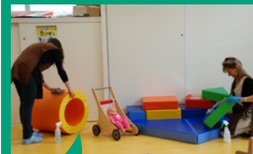
À VAL d'Anast, l'entretien des locaux