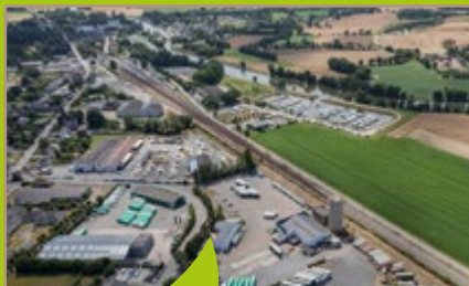
Zone d'activités Bonabry, Guipry-Messac