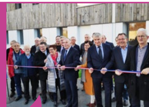
La réhabilitation de la Maison intercommunale a été inaugurée le 29 novembre 2019 en présence du sous-préfet de Redon, des parlementaires, du président du Département, du président de la Communauté de communes, d'élus communautaires et municipaux ainsi que des agents.