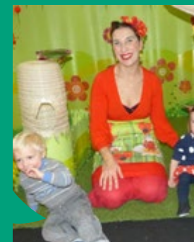
Spectacle au RIPAME