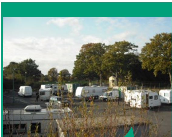
L'aire d'accueil des gens du voyage comporte 8 emplacements pour 16 caravanes

8 associations à vocation sociale sont subventionnées par VHBC ainsi que le CLIC pour lequel la communauté de communes attribue une cotisation par habitant.