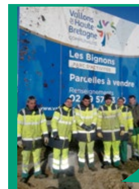
Les contrats aidés permettent de reprendre un rythme de travail par la réalisation de chantiers en équipe et de travaux valorisants