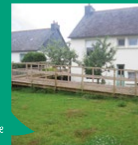
Aménagement pour favoriser l'autonomie