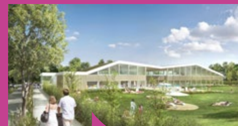
Esquisse de la vue extérieure de la future piscine intercommunale (BVL architecture).