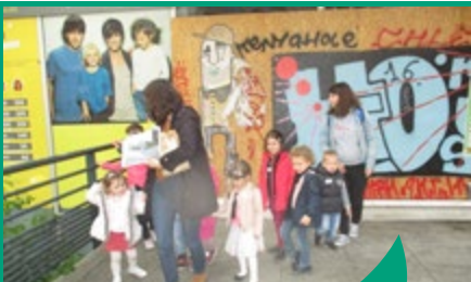
L'ALSH accueille les enfants de 3 à 12 ans le mercredi et pendant les vacances scolaires.