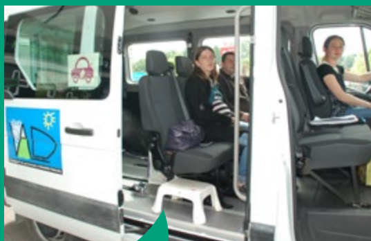
Le transport à la demande Naveteo Car propose un rabattement vers les lignes du réseau régional BreizhGo.