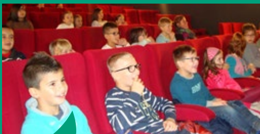
Ouvrir les enfants à la culture ...