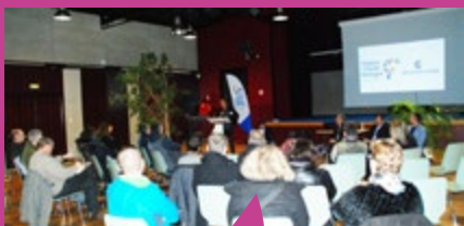
Rencontre économique à Guignen