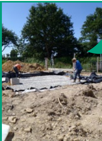
Contrôle du SPANC