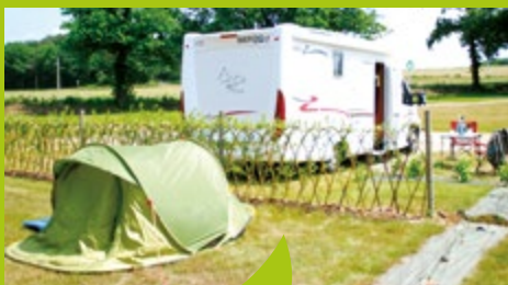
L'éco-camping des Buis à Les Brulais