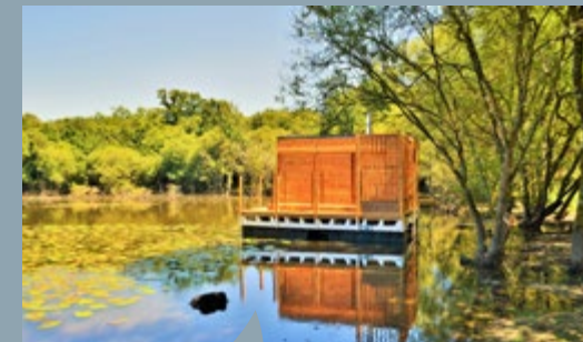
L'éco-camping des Buis est situé à proximité de la voie verte Messac-Guer.

Une convention d'objectif signée en début d'année a permis de développer des actions de promotion pour une participation financière de 10 000 €. L'objectif principal de ce partenariat est de communiquer sur notre offre touristique grâce au déploiement de plusieurs outils mis à notre disposition : encarts dans le magazine Rallycross, vidéo tourisme sur les écrans géants et présence sur le site web de l'événement.