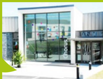
Le Chorus à Val d'Anast

autour des haltes ferroviaires et de la gare