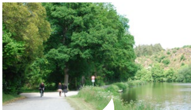
Chemin de halage Le Boël, Pont-Réan

Vallons de Haute Bretagne Communauté exerce ses compétences afin de répondre aux besoins des habitants et des entreprises installés sur son territoire. Aux compétences obligatoires (développement économique, aménagement de l'espace, Gemapi) s'ajoutent les compétences optionnelles et facultatives déléguées par les communes membres.