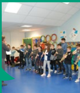
Répétition de l'orchestre à l'école George-Sand de Guipry-Messac dans le cadre du dispositif « Musiques à l'école ».