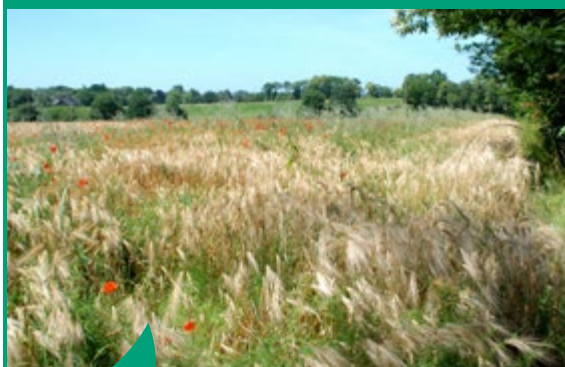
Grâce au programme Breizh bocage, la Communauté de communes participe à la reconstitution du maillage bocager