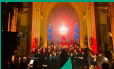
Concert de Noël à l'église Saint-Martin de Goven.