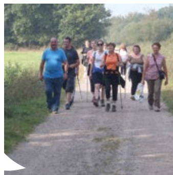
Le chantier d'insertion propose aussi à ses agents des actions en faveur de la santé (sport, cuisine...)