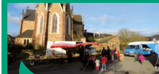
Dynamisme des centre-bourgs