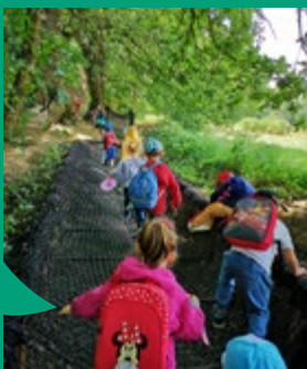
... et à de nouvelles pratiques de sports et de loisirs font partie des missions de l'ALSH (ici au jardin de Brocéliande).