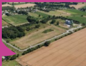
Parc d'activités Le Clos de la Barre, Guiry-Messac