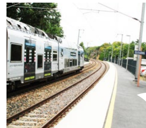
Chaque jour, le train reliant les villes de Rennes et Redon dessert la gare et les haltes ferroviaires du territoire.