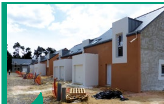
Construction de logements neufs