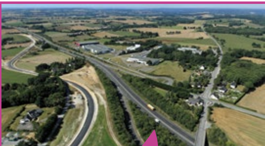
Le parc d'activités Le Mafay est idéal pour accueillir les PMI avec un accès direct à l'échangeur de l'axe Nantes-Rennes. Son extension est à l'étude.