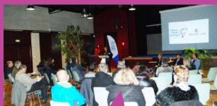
Rencontre économique à Guignen