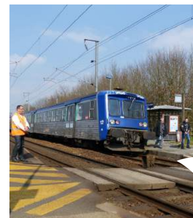
Chaque jour, le train reliant les villes de Rennes et Redon dessert la gare et les haltes ferroviaires du territoire.