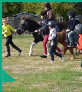
... et à de nouvelles pratiques de sports et de loisirs font partie des missions de l'ALSH.