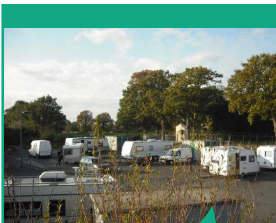
L'aire d'accueil des gens du voyage comporte 8 emplacements pour 16 caravanes