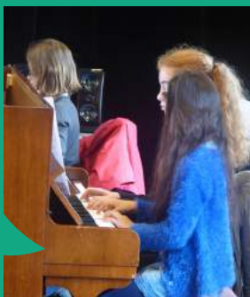
Les Portes ouvertes sont organisées en juin pour découvrir Musicole et s'y inscrire.