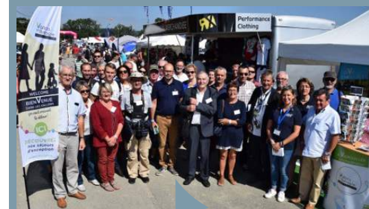
Inauguration de l'image de marque Vallons en Bretagne au Rallycross de Lohéac le 1 er septembre 2018