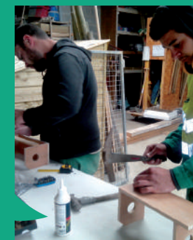
À Guichen, l'entretien du bâti