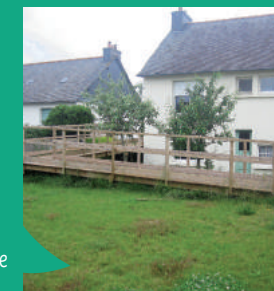
Aménagement pour favoriser l'autonomie