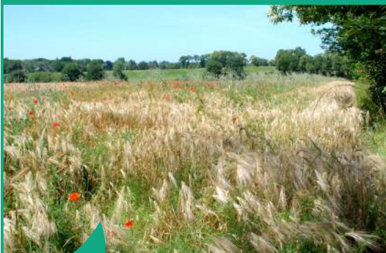
Grâce au programme Breizh bocage, la Communauté de communes participe à la reconstitution du maillage bocager