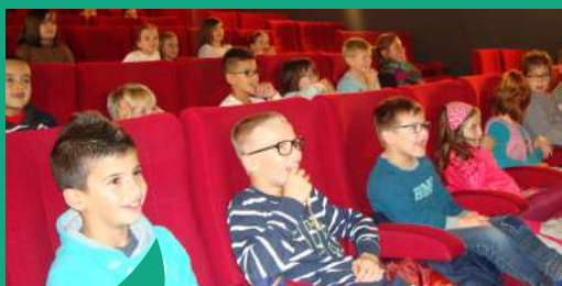
Ouvrir les enfants à la culture...