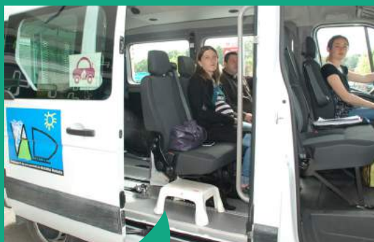
Le Transport à la Demande a évolué en 2018 avec Naveteo Car qui propose un rabattement vers les lignes du réseau de Breizh Go (ex Illenoo et keolis armor)