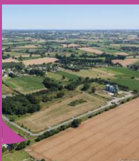
Parc d'activités Le Clos de la Barre, Guiry-Messac