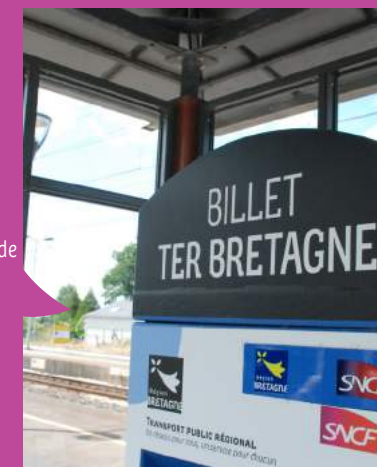
A la gare de Guipry-Messac