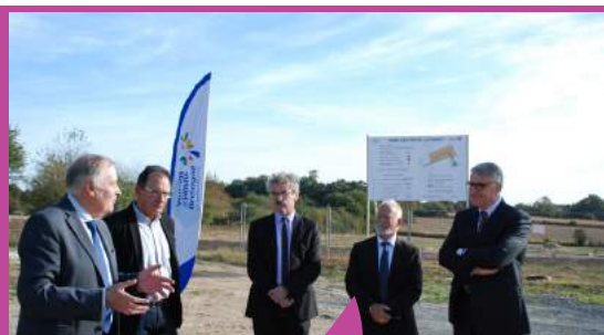
Inauguration du Parc d'activités du Guény à Baulon le 26 septembre 2018