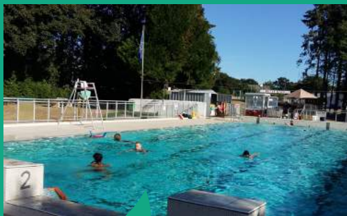
La piscine communautaire à Guipry-Messac

ger la baisse des émissions polluantes et la réduction du trafic routier en promouvant l'usage des transports collectifs.