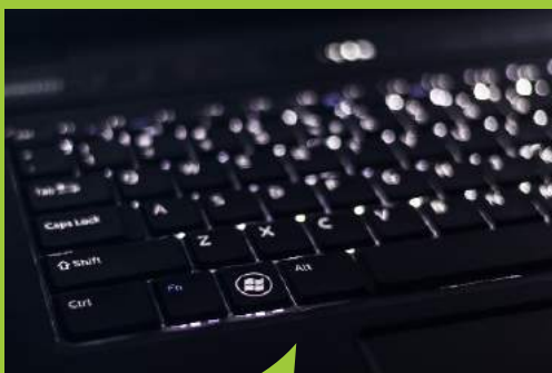
Une réflexion est menée pour créer un service mutualisé d'administration et de gestion des systèmes d'information