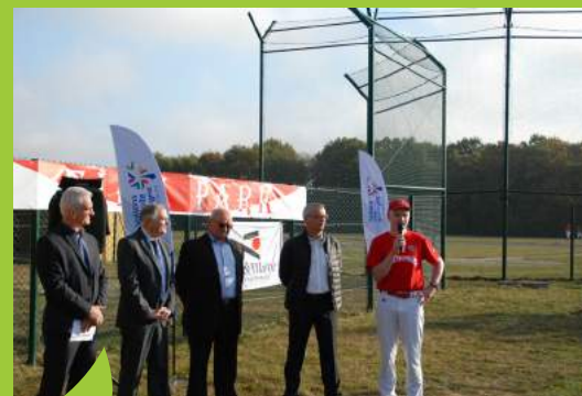
Inauguration du terrain de Baseball le 6 octobre 2018 à Val d'Anast

Escales paraît 4 fois par an en janvier, avril, juillet et octobre