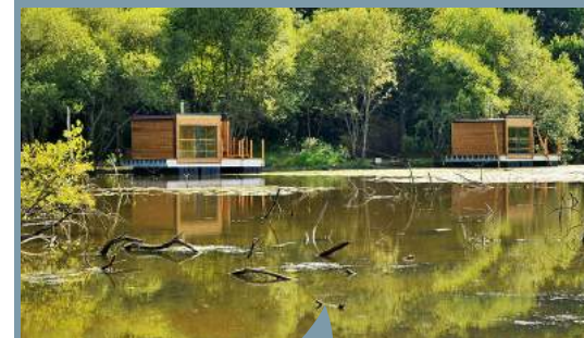
Hébergements insolites sur l'éco-camping des Buis

Stand tourisme dans la fanzone Inauguration de la marque touristique « Vallons en Bretagne » avec les partenaires et institutionnels Jeu- concours avec plus de 350 participants