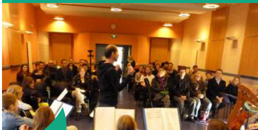
Des auditions ont lieu régulièrement pour permettre aux élèves de partager leurs apprentissages