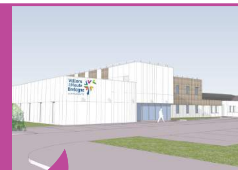
Esquisse de la future Maison intercommunale Crédit : Magma architecture

Vallons de Haute Bretagne Communauté a défini son plan pluriannuel de mobilité à l'échelle intercommunale visant à optimiser et augmenter l'efficacité des déplacements des habitants. Ce plan de mobilité a pour ambition d'encoura-