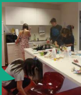
Espace jeunes à Val d'Anast