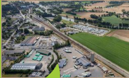
Zone d'activités Bonabry, Guipry-Messac