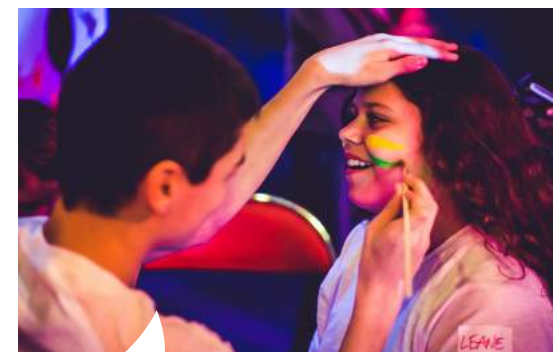
Les Nocturnes font partie des événements phares organisés par les PIJ.

Vallons de Haute Bretagne Communauté compte deux Points information jeunesse (PIJ) ; l'un à Guichen au Réso, l'autre, à Maure de Bretagne dans les locaux du Chorus. Les PIJ ont pour but d'offrir un égal accès à l'information pour tous les jeunes du territoire, quelle que soit leur commune de résidence. Par ailleurs les animateurs des Points information jeunesse proposent d'accompagner les jeunes dans leurs projets individuels et collectifs, qu'il s'agisse de voyage, de formation... Des dispositifs de financement peuvent d'ailleurs être mis en place pour mener à bien ces projets.