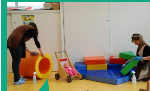
À VAL d'Anast, l'entretien des locaux