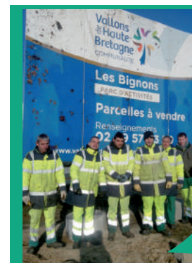
Les contrats aidés permettent de reprendre un rythme de travail par la réalisation de chantiers en équipe et de travaux valorisants