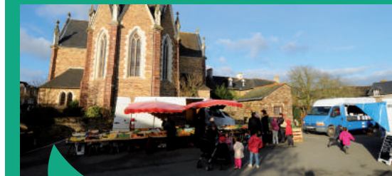
Dynamisme des centre-bourgs