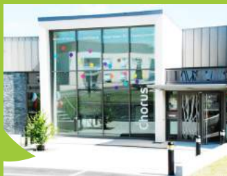
Le Chorus à Val d'Anast