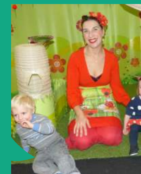
Spectacle au RIPAME