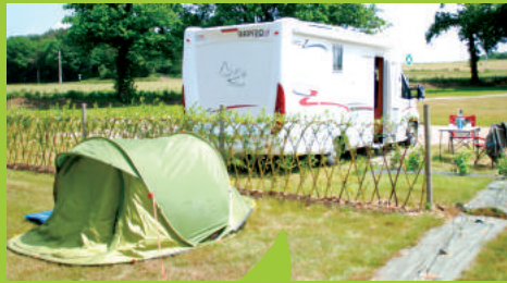
L'éco-camping des Buis à Les Brulais