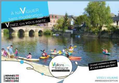
Exemples de cartes postales éditées sous la bannière Vallons en Bretagne