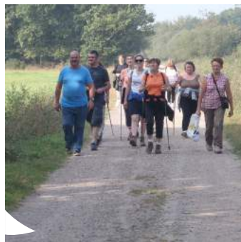
Le chantier d'insertion propose aussi à ses agents des actions en faveur de la santé (sport, cuisine...)