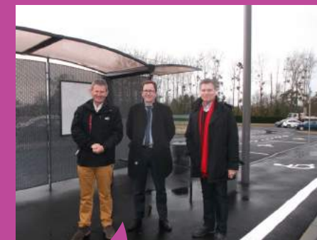
Aire d'accueil multimodale à Lohéac