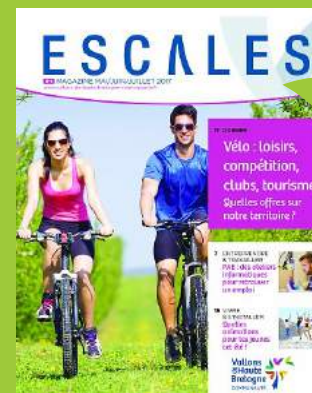
Escales paraît 4 fois par an