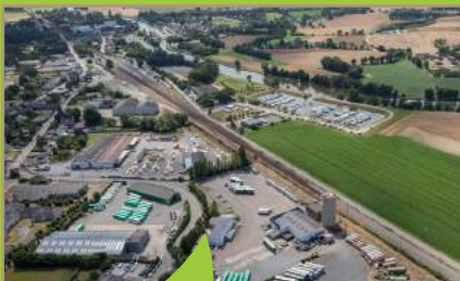
Zone d'activités Bonabry, Guipry-Messac