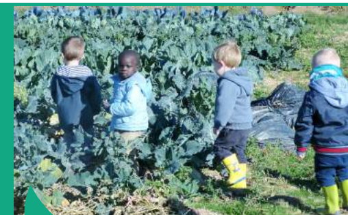
Cueillette à la ferme