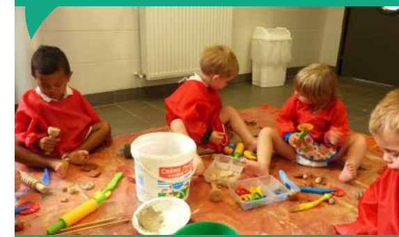
Atelier argile et barbotine au multi-accueil.