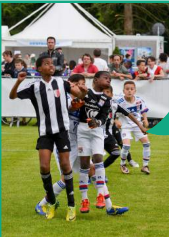
Le tournoi FCGM Champions League à Guipry-Messac se déroule au mois de mai chaque année