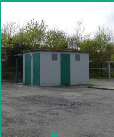
Plusieurs travaux de réhabilitation des blocs ont permis une réouverture en 2017

L'aire d'accueil des gens du voyage, conventionnée par l'Etat depuis 2005, est située à Guichen. Elle comporte 8 emplacements pour 16 caravanes. Une coordinatrice sociale a en charge l'accueil et l'information des familles, le recueil des documents administratifs, le relevé des compteurs et l'enregistrement des factures. Elle accompagne également les familles dans leurs démarches avec les services extérieurs (scolarisation, services sociaux, santé ...) et est la référente en matière d'organisation d'actions et d'animations.