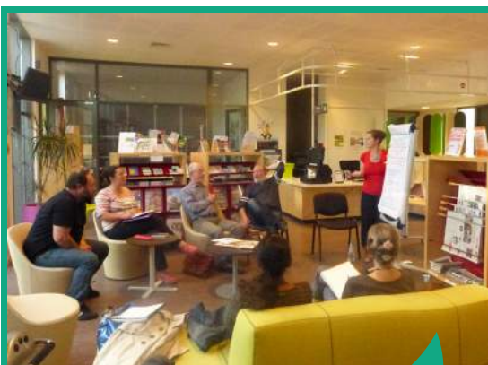
Au Chorus, un Conseil des habitants participe à l'animation du Centre social.