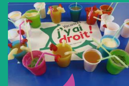
Proposer des séjours et des activités aux jeunes pendant les vacances fait partie des missions des Espaces jeunes.