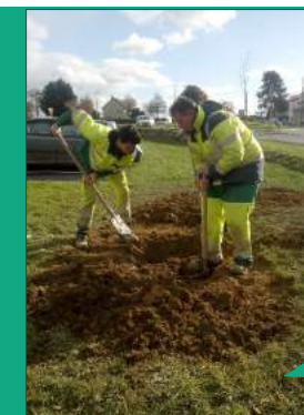
Les contrats aidés permettent de reprendre un rythme de travail par la réalisation de chantiers en équipe et de travaux valorisants