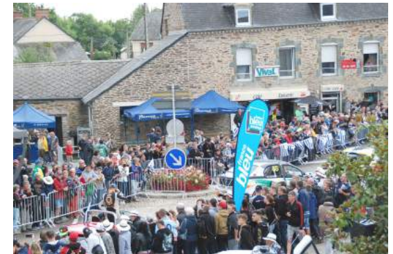
Le Rallycross de Lohéac attire 75 000 visiteurs

En partenariat avec le service Développement Économique, le service Tourisme avait un stand dans la fanzone du Rallycross de Lohéac les 2 et 3 septembre 2017.