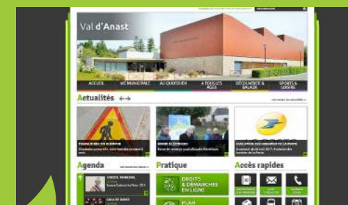
Le portail Internet communautaire www.vallons-de-haute-bretagne.fr