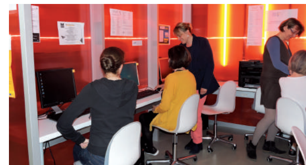
Des ateliers informatiques pour les grands débutants sont organisés par le PAE.