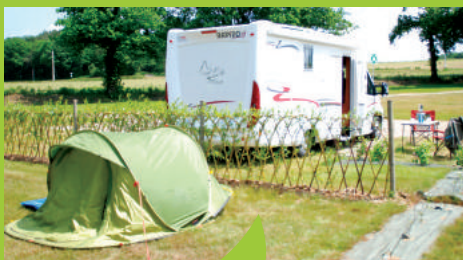
L'éco-camping des Buis à Les Brulais