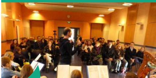
Des auditions ont lieu régulièrement pour permettre aux élèves de partager leurs apprentissages