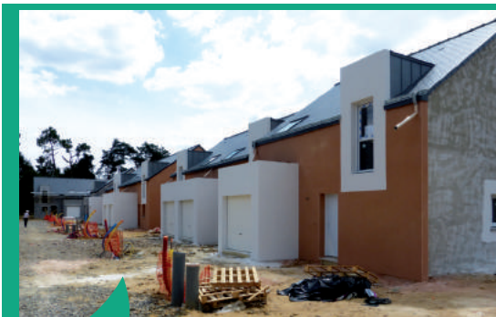
Construction de logements neufs