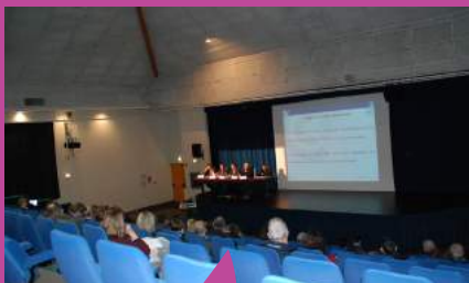
Rencontre économique sur le thème de la reprise-transmission d'entreprise en avril 2017