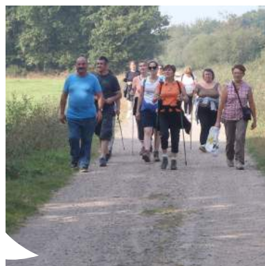
Le chantier d'insertion propose aussi à ses agents des actions en faveur de la santé (sport, cuisine...)