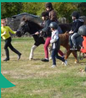
... et à de nouvelles pratiques de sports et de loisirs font partie des missions de l'ALSH.