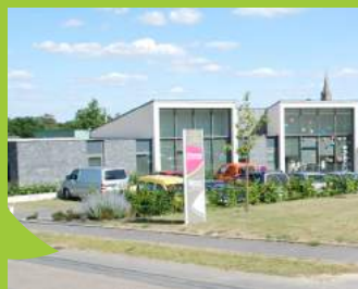
Le Chorus à Val d'Anast