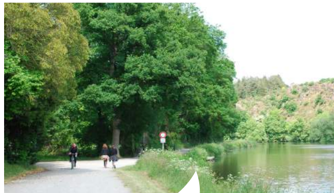
Chemin de halage Le Boël, Pont-Réan

Vallons de Haute Bretagne Communauté est née le 1 er janvier 2014. Elle est issue de la fusion de Maure de Bretagne Communauté et de l'ACSOR ainsi que des communes de Guipry-Messac, Lohéac et Saint-Malo-de-Phily. Vallons de Haute Bretagne Communauté regroupe 18 communes, totalisant plus de 42 000 habitants. Située à mi-chemin entre Rennes et Redon, elle ambitionne de devenir un territoire attractif, du point de vue économique, touristique ou de la qualité de vie. C'est pour cela que le Président, les onze vice-présidents et l'ensemble des conseillers communautaires travaillent au quotidien. Ils s'attachent particulièrement à développer le territoire de manière harmonieuse pour offrir à tous les habitants un égal accès aux services, quelle que soit leur commune de résidence.