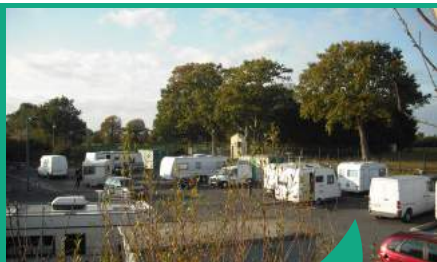
L'aire d'accueil des gens du voyage comporte 8 emplacements pour 16 caravanes