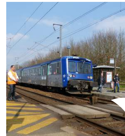
Chaque jour, le train reliant les villes de Rennes et Redon dessert la gare et les haltes ferroviaires du territoire.

Le Conseil communautaire est composé de 48 délégués élus lors des élections municipales de 2014. Il choisit les orientations, définit les grands projets et vote les budgets de la Communauté de communes. Il élit en son sein le bureau, auquel il délègue des attributions. Les membres du bureau préparent les décisions qui seront soumises au Conseil communautaire. Chacun des membres du bureau préside une commission. Le rôle de ces commissions est d'étudier les projets en s'appuyant sur des compétences techniques et d'être force de propositions pour le Conseil communautaire.