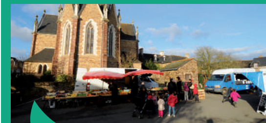
Dynamisme des centre-bourgs