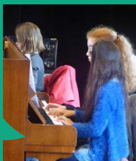
Les Portes ouvertes sont organisées en juin pour découvrir Musicole et s'y inscrire.