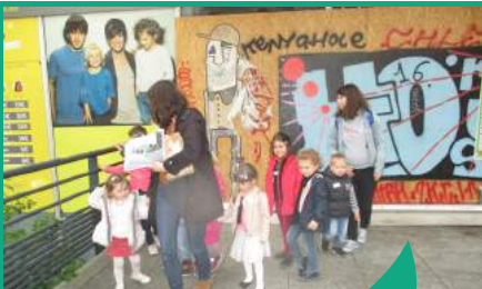
L'ALSH accueille les enfants de 3 à 12 ans le mercredi et pendant les vacances scolaires.