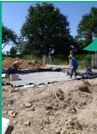
Contrôle du SPANC