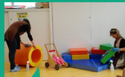
À Val d'Anast, l'entretien des locaux