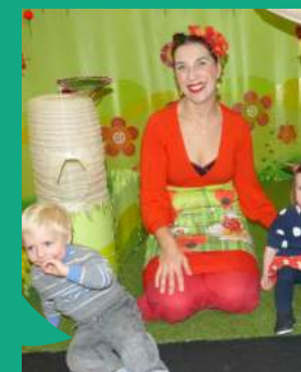
Spectacle au RIPAME