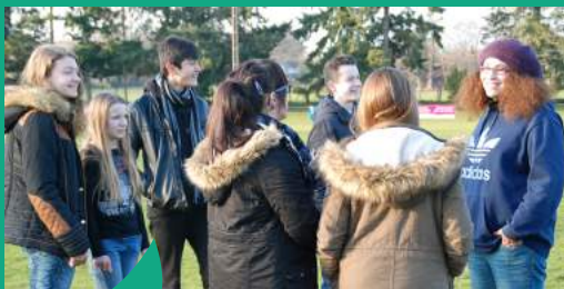
Espace jeunes en itinérance