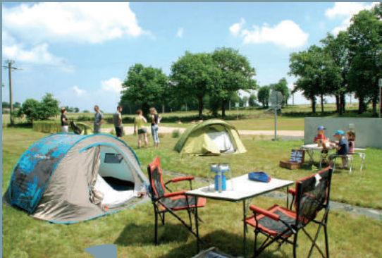
L'éco-camping Les Brulais