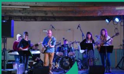
Chaque année, Musicole participe à la Fête de la Musique.