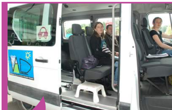
Le Transport à la Demande