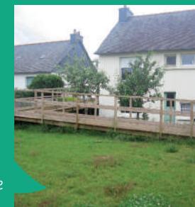
Aménagement pour favoriser l'autonomie