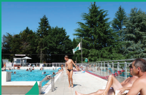
La piscine communautaire à Guipry-Messac