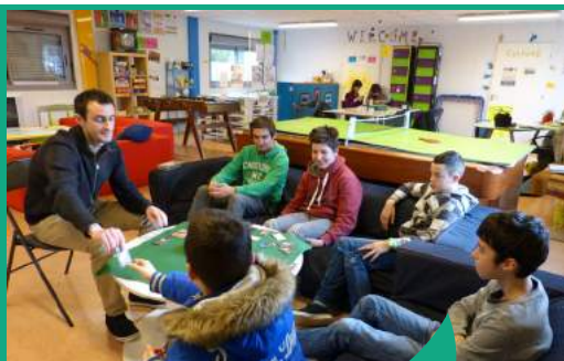
Espace jeunes à Guipry-Messac