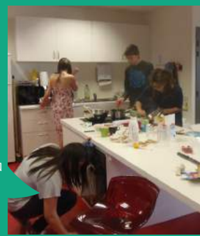
Espace jeunes à Val d'Anas